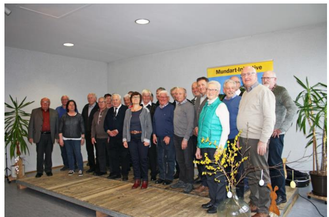
Die Aktiven des Mundart-Nachmittags in Grenderich.

Mehr als 60 Teilnehmer folgten der Einladung